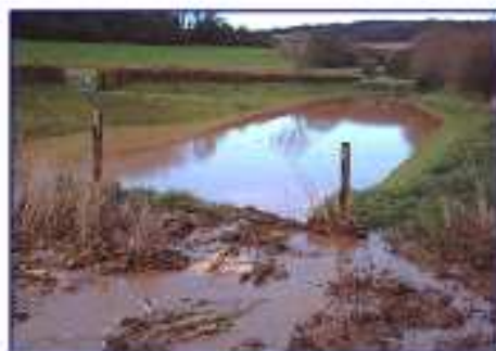
Bassin du fond d'Assigny