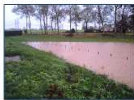
BIV03 à Biville sur Mer