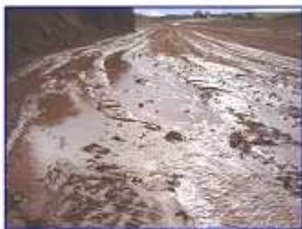
Ruissellements sur parcelle nue