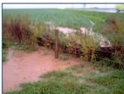
Ruissellements à travers une fascine.

La campagne d'hydraulique douce basée sur le volontariat des exploitants est lancée depuis 2006. Chaque année nous réalisons des aménagements découlant de la Déclaration d'Intérêt Général, des diagnostics érosion chasse et des diagnostics érosion réalisés par la Chambre d'Agriculture.