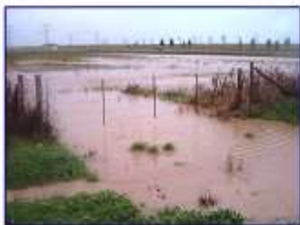
BIV01 à Biville sur Mer