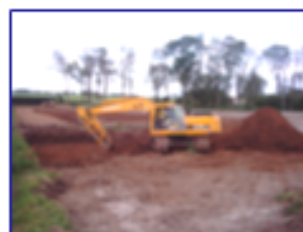
Travaux de BTVOS Mai 2009