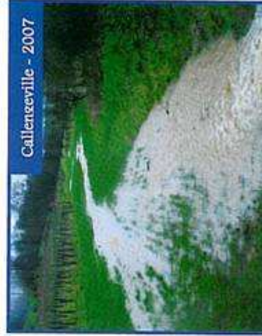
Calleneville - 2007