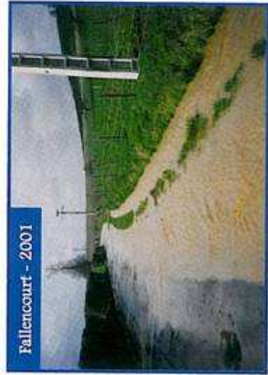
Fallencourt - 2001