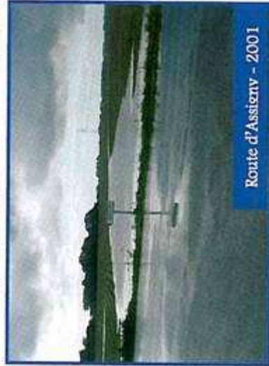
Route d'Assierny - 2001